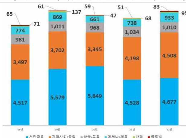
국내은행 사회공헌활동 분야별 지출금액